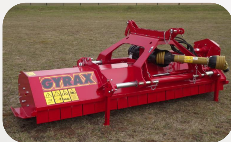
Version B H M

Attelage arrière et frontal (Option déport hydraulique)