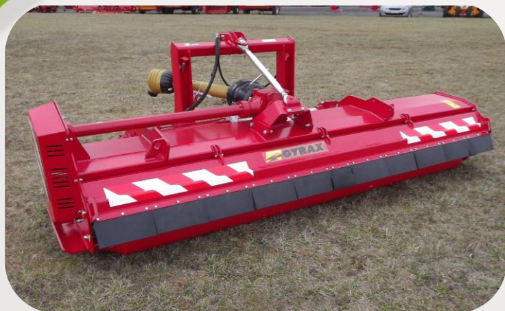
Version B H