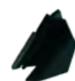
Nez de protection