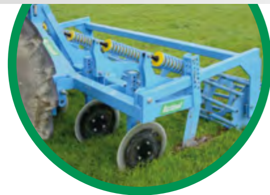
RÉGLAGE HYDRAULIQUE DE LA PROFONDEUR DE TRAVAIL